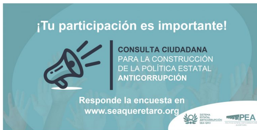
Figura 3. Cartel promocional de la consulta ciudadana en Querétaro (SEA Querétaro, 2020)

Se reporta que el período de aplicación fue digital, del 9 de septiembre al 9 de octubre de 2020. El 21 de septiembre de 2020 se llevó a cabo un evento para difundir la consulta ciudadana, con la presencia de cámaras empresariales, asociaciones, colegios, instituciones educativas, y líderes de agrupaciones de San Juan del Río, Ezequiel Montes y Tequisquiapan.