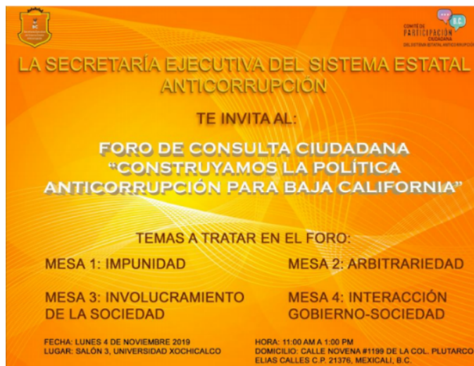
Figura 1. Cartel promocional de los foros de consulta ciudadana

opiniones y propuestas de organizaciones de la sociedad civil, la academia, el sector privado y personas servidoras públicas locales.